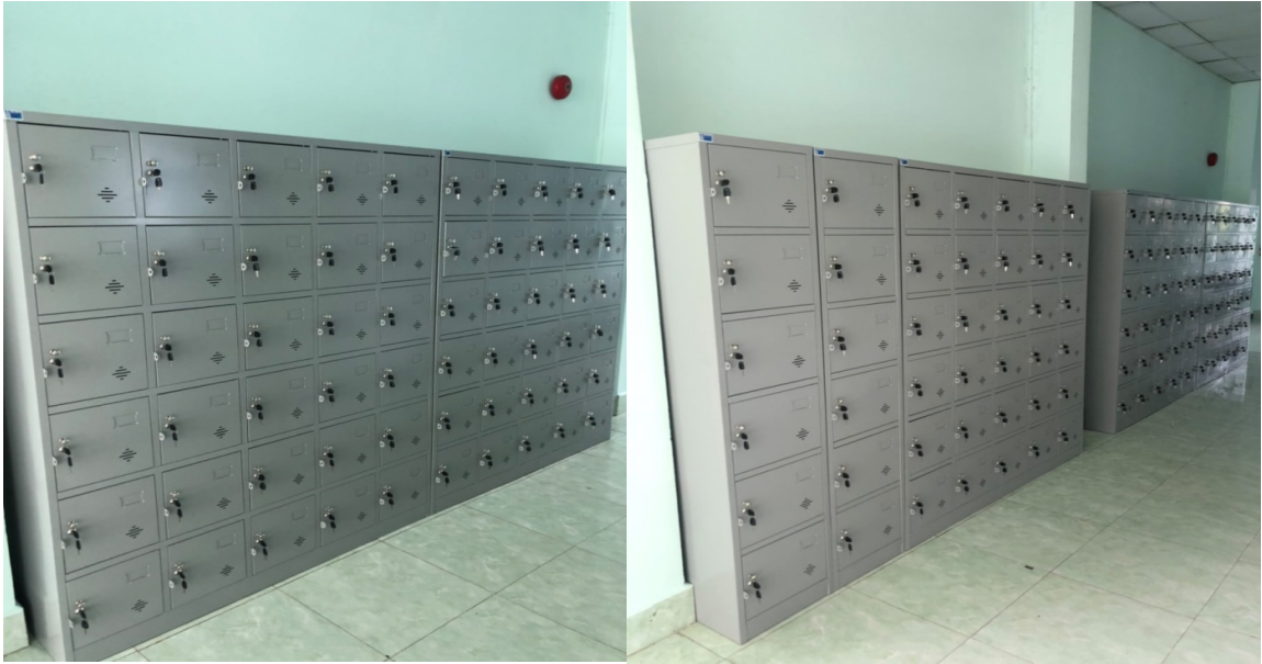
Hình ảnh tủ chứa đồ cá nhân cho thí sinh chụp từ camera quan sát

Để kiểm tra an ninh, ngăn chặn việc thí sinh mang tài liệu, đồ dùng trái phép vào phòng thi, Nhà trường trang bị thiết bị kiểm tra an ninh cầm tay tại các khu vực tổ chức thi, có hệ thống camera giám sát ghi được toàn bộ diễn biến của cả phòng thi liên tục trong suốt thời gian thi.