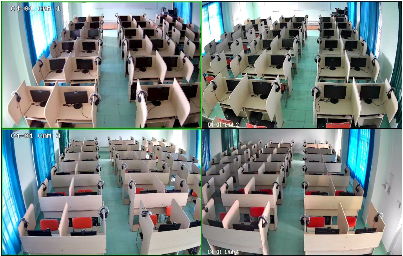
Hình ảnh phòng thi trên máy chụp từ camera phòng thi